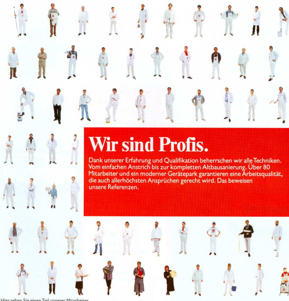
Hier sehen Sie einen Teil unserer Mitarbeiter.