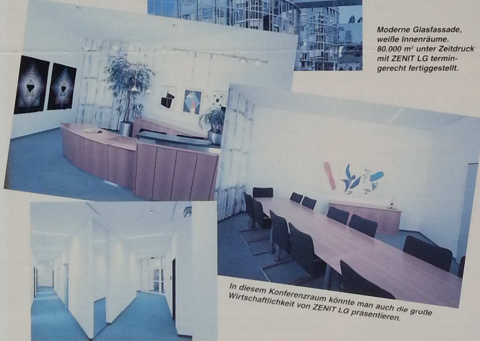
Moderne Glasfassade, weiße Innenräume. 80.000 m 2 unter Zeitdruck mit ZENIT LG termingerecht fertiggestellt.