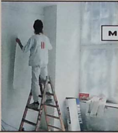
Mit Variovlies und Ovalit GF Konzentrat geht alles glatt

Probetapezierung eines Hotelzimmers: Mit der strukturlosen Vliesfaservariante geht alles glatt. Die Oberfläche wirkt einheitlich, die Stöße stimmen und bei der Verarbeitung gibt es keinen Ärger mehr mit störenden, juckenden Glasfasern.