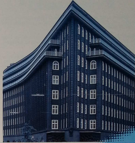
Im Chile-Haus, einer Hamburger Institution, erhielten rund 60.000 m 2 Innenflächen ein neues Make up. In Arbeit befindet sich das Deutsch-Japanische Zentrum mit 30.000 m 2 . Immer erfolgte der Zuschlag für Firma Harms mit ZENIT LG: wegen hoher Deckkraft, geringer Verbrauchsmengen, günstiger Material- und Lohnkosten – und damit wettbewerbsstarker Preise!